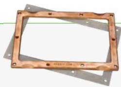
HULPSTUKKEN VOOR FOLIEBAD